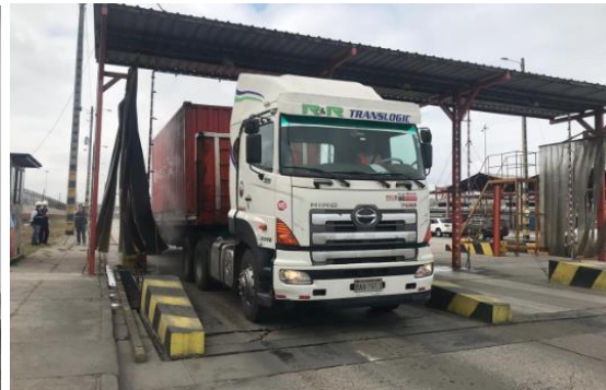
Fumigación de contenedores

Hasta el cierre del mes de Julio del 2019 Instituto Colombiano Agropecuario ICA no confirmaba la presencia del Fusarium Raza 4.