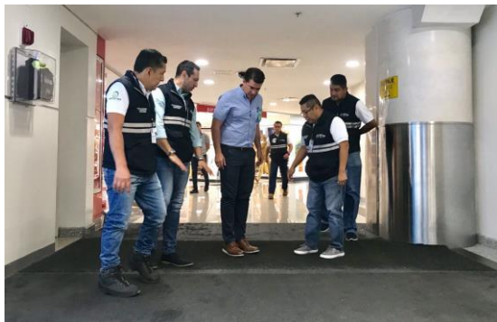
Control en aeropuertos